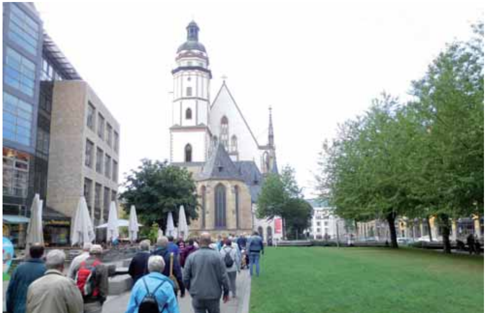
Auf dem Weg zum Auftritt in der Thomaskirche

Pünktlich um 6 Uhr am Wochenende des 17. und 18. September fuhren Mitglieder des Gesangsvereins Zierenberg und Just Voices zu unserem ersten Ziel nach Merseburg. Bevor wir die ehemalige deutsche Grenze überfahren bekamen wir ein Visum ausgehändigt und wurden mit echten DDR-Leckereien versorgt. Gut ausgerüstet nahmen wir bei strömenden Regen an einer Stadtführung in Merseburg teil. Leider konnten wir uns den Dom als auch das Schloss nur von außen betrachten. Das war sehr schade. Aber es gab einen Lichtblick. Zum Ende der Führung klarte das Wetter auf und die Schirme konnten wieder geschlossen werden. So war der Blick frei für eine Besonderheit in Merseburg. In dieser Stadt wurden alle Fassaden der hässlichen DDR-Plattenbauten neu gestaltet. Beim ersten Hinsehen war keiner der Plattenbauten noch als solche erkennbar. Ganz im Gegenteil, mit neuen Anbauten unterschiedlichster Art und guter Farbenwahl entstanden echte Schmuckstücke. Aber auch der Altstadt kern kann sich sehen lassen. Anschließend erwartete uns im Merseburger Ratskeller ein üppiges Rittermahl, das wir nicht mit Fingern zu uns nehmen mussten. Nachdem wir uns gesättigt hatten ging