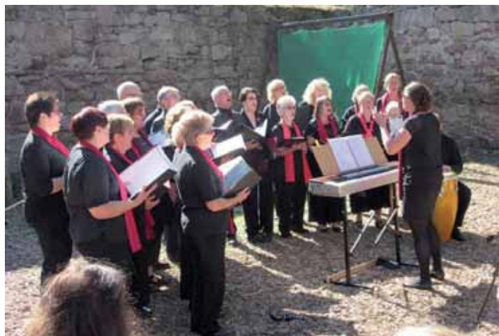
Vivo Canto Gem. Chor Weidenhausen