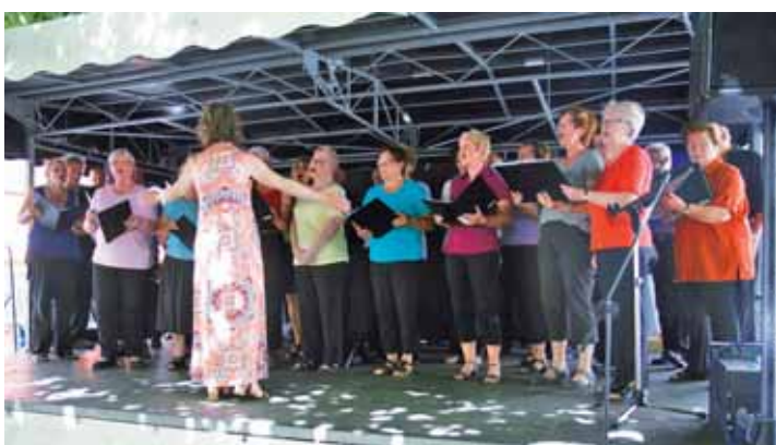
Gemischter Chor Gesangverein Guxhagen