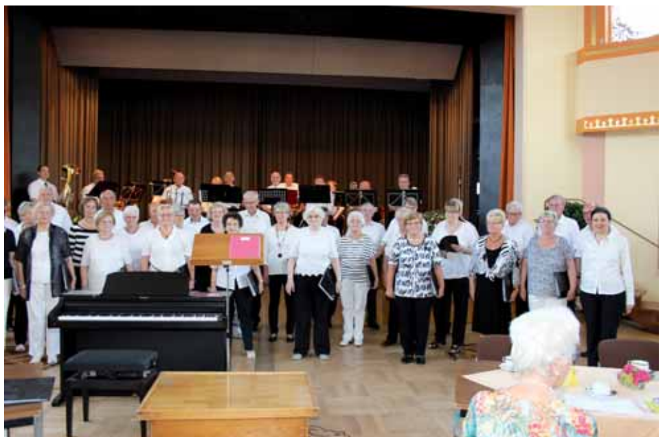
Gemischter Chor der Liedertafel Karlshafen mit Kurkapelle