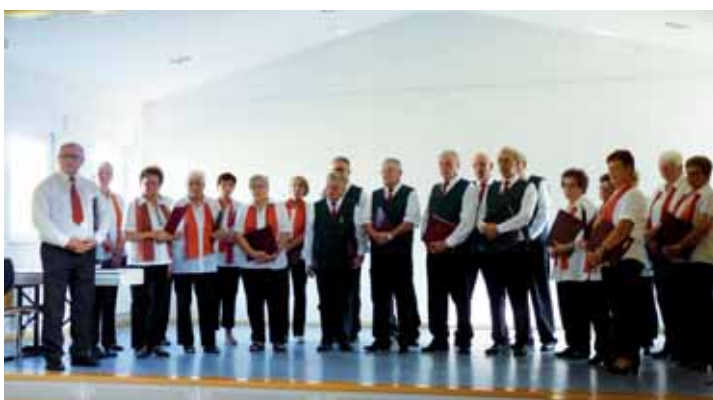
Gemischter Chor Ernsthausen

Redaktionsschluss für die nächste Ausgabe CHORSÄNGER ist am 3. März 2017