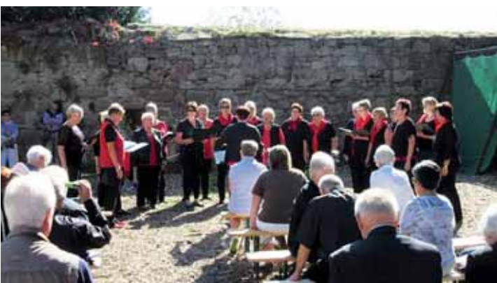
Pro Musica Bottendorf