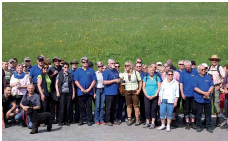
MGV-Liederkrantz Erligheim und MGV Eichenberg mit Wanderführerin

Am 20. 03. 2016 wurde, im Rahmen des 160-jährigen Bestehens der Liedertafel Treysa verbunden mit einem großen Konzert in der Stadtkirche zu Treysa, Reinhard Spratte das Sonderehrenzeichen in Gold vom Vizepräsidenten des MSB Herrn Klaus-Dieter Kaschlaw, verliehen.