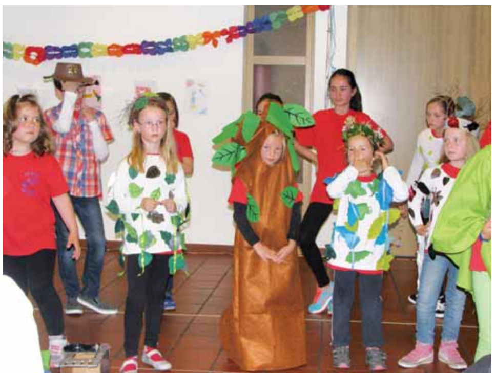
Goldbachlerchen bei Karnevalsfeier

Chorgruppen: Den Kleinen Goldbachlerchen von 5 Jahren bis zur 2. Klasse, den Großen Goldbachlerchen mit Kindern der 3. und 4. Klasse, sowie den Teens ab der 5. Klasse.