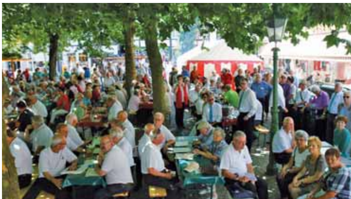
Blick ins Publikum