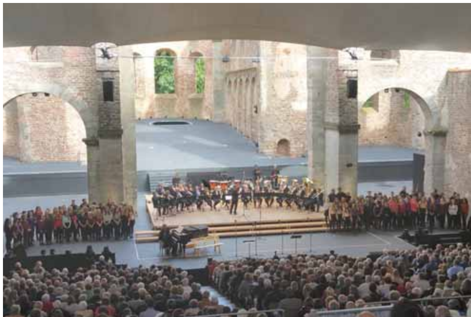
Konzert in der Stiftsruine Hersfeld

Malerischer vermag man sich ein typisch englisches Städtchen kaum vorstellen. Kleine Cottages inmitten einer charmanten mittelalterlichen Kulisse säumen die Straßen und hier und dort lädt der oder andere urige Pub zum Verweilen ein. Fast hat man den Eindruck, als stünden Miss Marple und Inspector Barnaby hinter der nächsten Ecke. Kein Wunder, dass die 25 Mitglieder des Blechbläserensembles der Modell- und