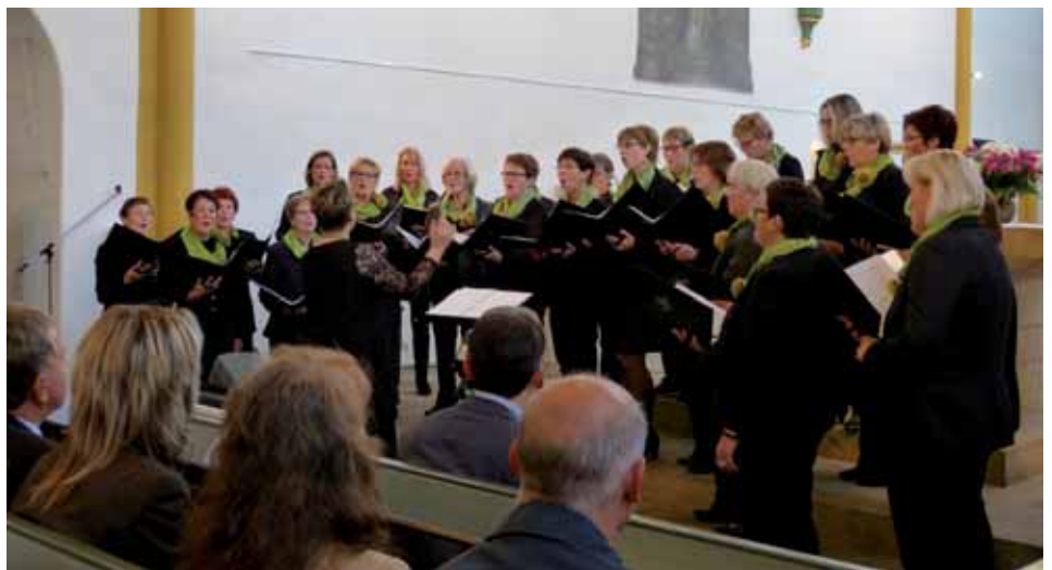
Frauenchor „New Voices“