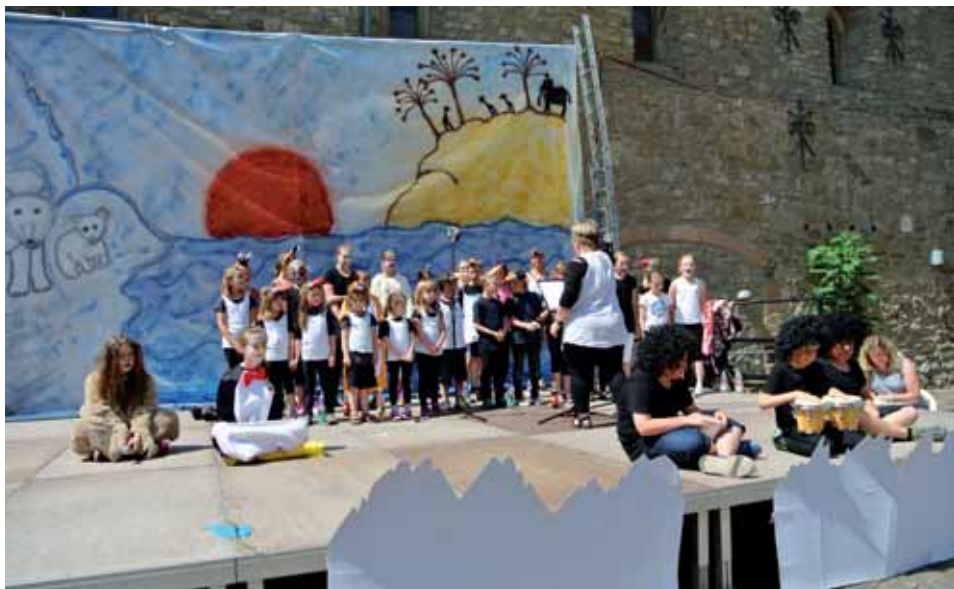
Musical Paul der Pinguin