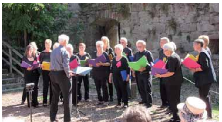
Gemischter Chor Scheden