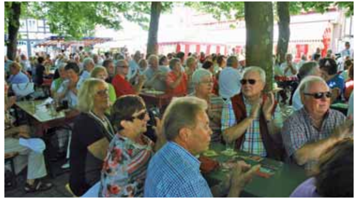
Blick ins Publikum