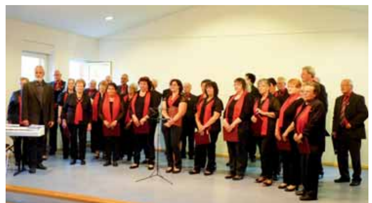
Gemischter Chor Momberg