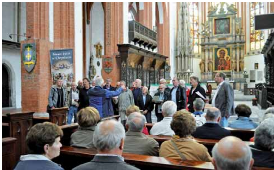
MGV-Gleichen in der Breslauer Soldatenkirche

Begegnungen trafen sich wieder. Zusammen mit dem ortsansässigen Frauenchor wurde viel gesungen. Zu einem Kanon lud man auch die Zuhörer ein, so dass der ganze Raum gemeinsam sang und sich dabei in den Armen lag.