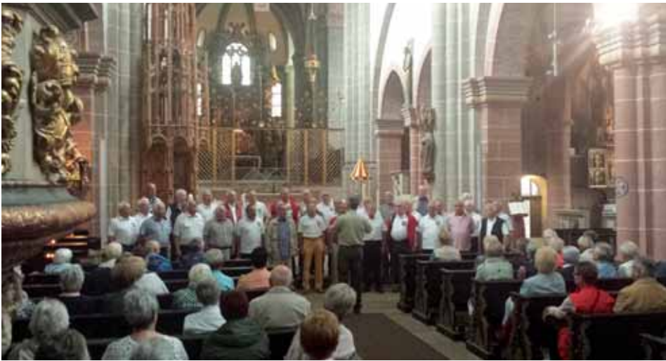
Auftritt des Polizeichores Kassel im Fritzlarer Dom

Ausflug zum Edersee fortgesetzt. Bis zum Ablegen des Fahrgastschiffes „Edersee Star“ um 13.25 Uhr nutzten einige die Gelegenheit zu einem kleinen Spaziergang zur Sperrmauer. Während der zweistündigen „Kreuzfahrt“ auf dem 27 km langen See wurde die Reisegruppe mit Kaffee und Kuchen bewirtet und durch die Sänger mit dem „Hessenlied“, „Bajazzo“ und „Mala moja“ unterhalten. Danach ging es weiter zum 200 m höher gelegenen Schloss Waldeck, dem Wahrzeichen der Region. Wer den mühseligen Aufstieg vom Parkplatz zum Schlosshof nicht scheute, wurde mit einer herrlichen Aussicht auf den Edersee mit seinen vielen Segelbooten belohnt, auch wenn es leicht nieselte. Nichtsdestotrotz brachten die Sänger spontan einem Brautpaar, das dort Hochzeit feiern wollte, zum Vergnügen der gesamten Gesellschaft ein Ständchen: „Bajazzo“ und „Ich bete an die Macht der Liebe“. Der Abschluss der Tagestour fand in der Veranstaltungsscheune „Koppenretschler“ in Bad Wildungen-Wega statt. Bei einem Grillbüfett und mit Liedbeiträgen ließ man den Tag ausklingen. Zur Überraschung der Gäste kamen zwei Pfeiffer im Schottenanzug in den Veranstaltungsraum