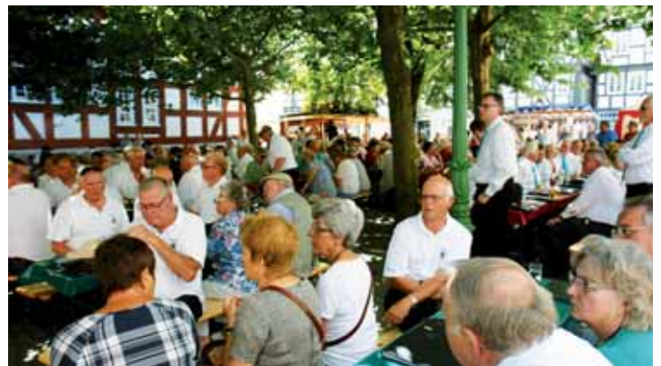
Blick ins Publikum