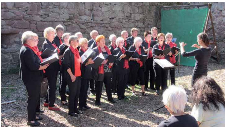
Volkschor 1913 Ihringshausen