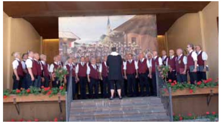
Auftritt der Chöre bei der Abschlussveranstaltung

Besucher des Berggasthofes war es ein besonderer Ohrenschaus.