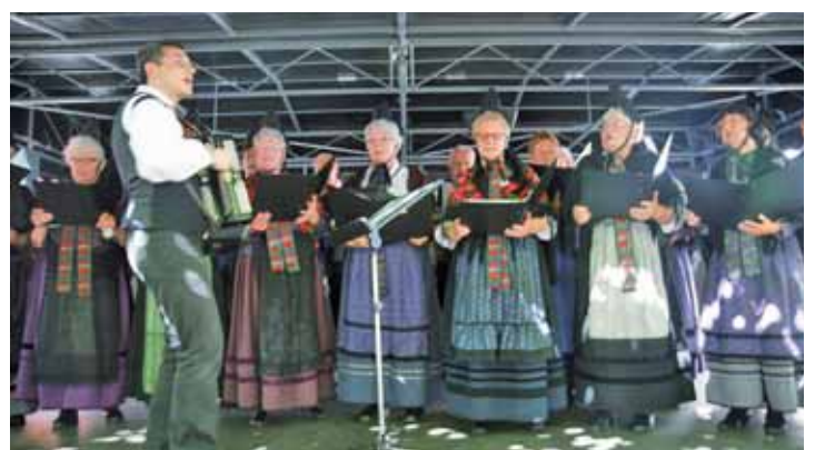
Volksliederchor des Heimat- und Kulturvereins Obermöllrich