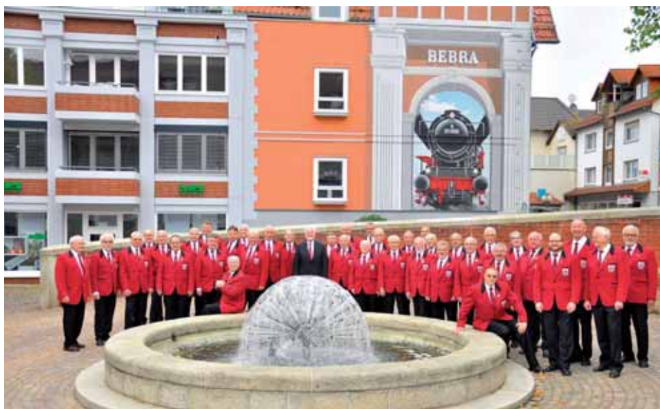
Eisenbahnchor Germania Bebra im Jubiläumsjahr 2016