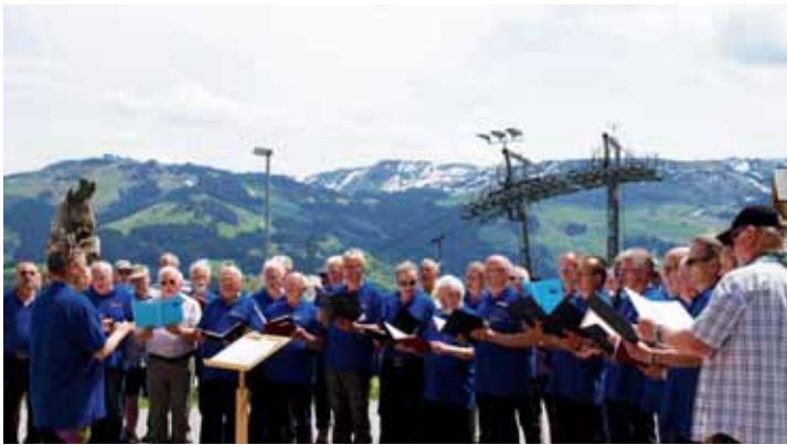
Singen der Chöre auf der Geisbergalm