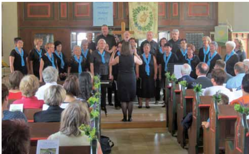
140 Jahre Liedertafel Wichdorf

Danach wurde es mit den Liedern des gemischten Chores sehr andächtig, da mit