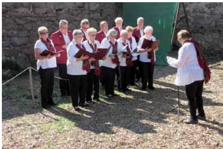
MGV-Gemischter Chor Laudenbach