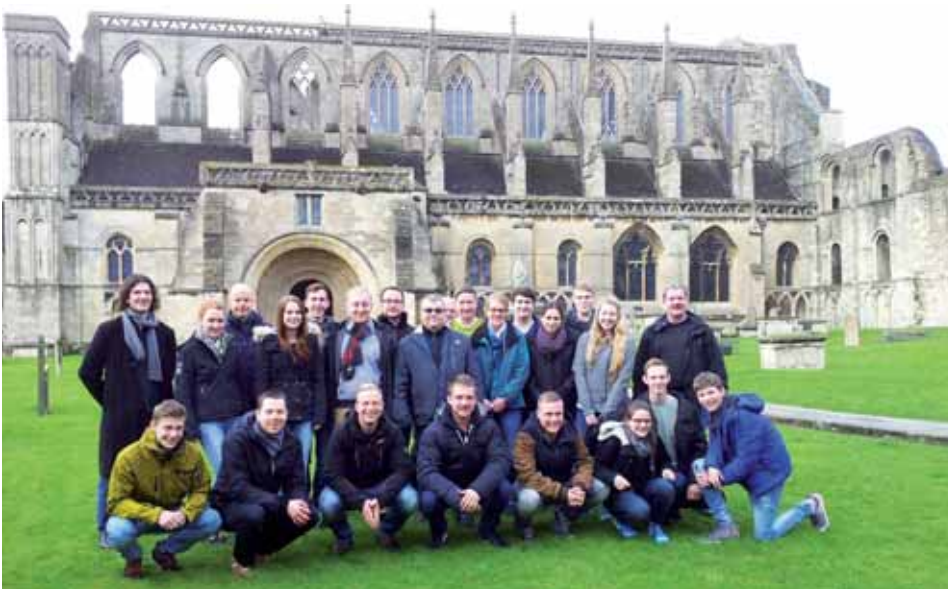
Blechbläserensemble der Modell- und Gesamtschule Obersberg und der Konrad-Duden-Schule auf Konzertreise in England