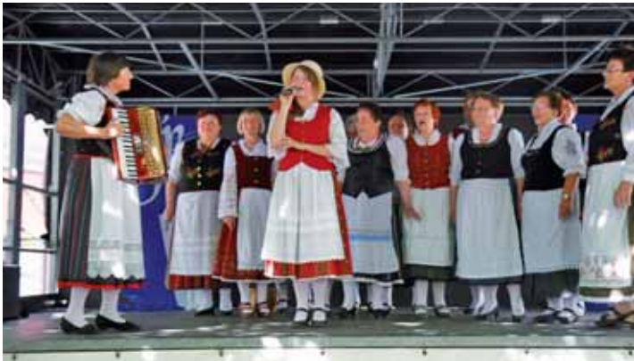
Russlanddeutscher Frauenchor „Rjabinuschki“