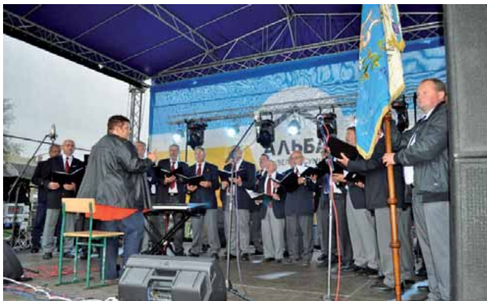
MGV-Gleichen beim Stadtfest in Schtschyrez