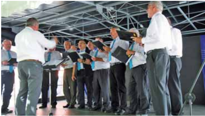
MGV „Sangeslust“ Herlefeld