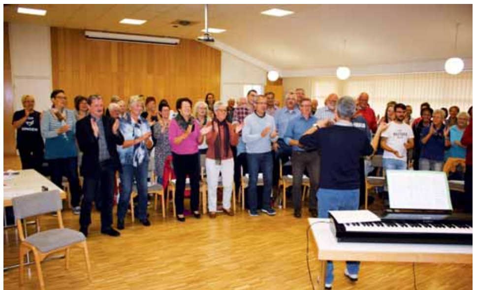
Fortbildungsseminar des Sängerkreises Hersfeld

„Ich hatte Glück, denn es gab zu der Zeit keinen Chor und keine Blechbläser an der