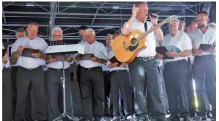
MGV „Liedertafel“ Spangenberg