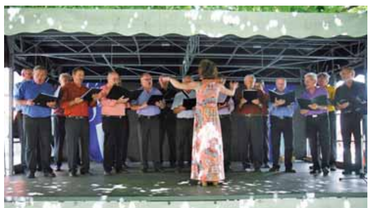
Männerchor Gesangverein Guxhagen