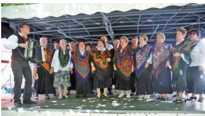
Aussiedlerchor „Echo“ der Ev. Gemeinde Baunatal Altenbauna