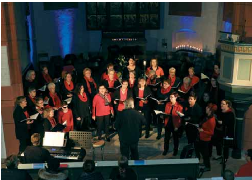
Kirchen- und Frauenchor Rauschenberg