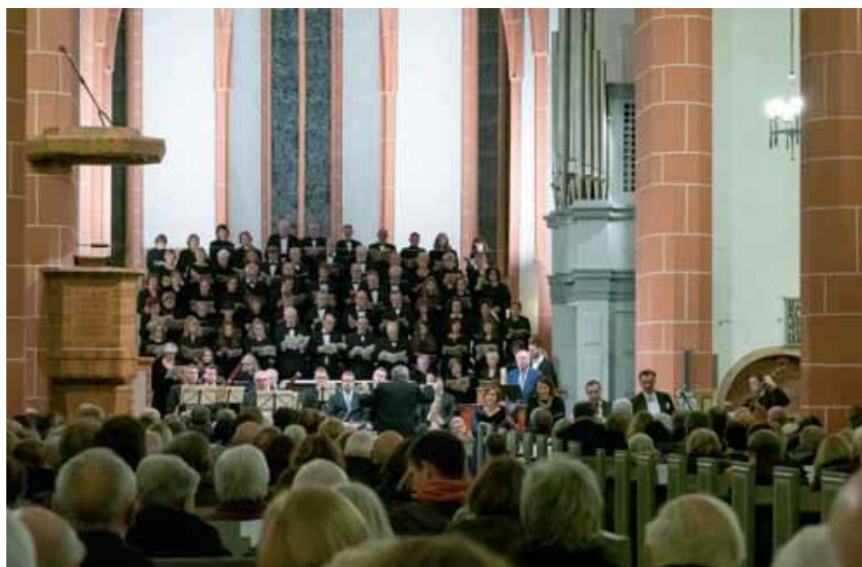
Chor 2019 in Bad Hersfeld