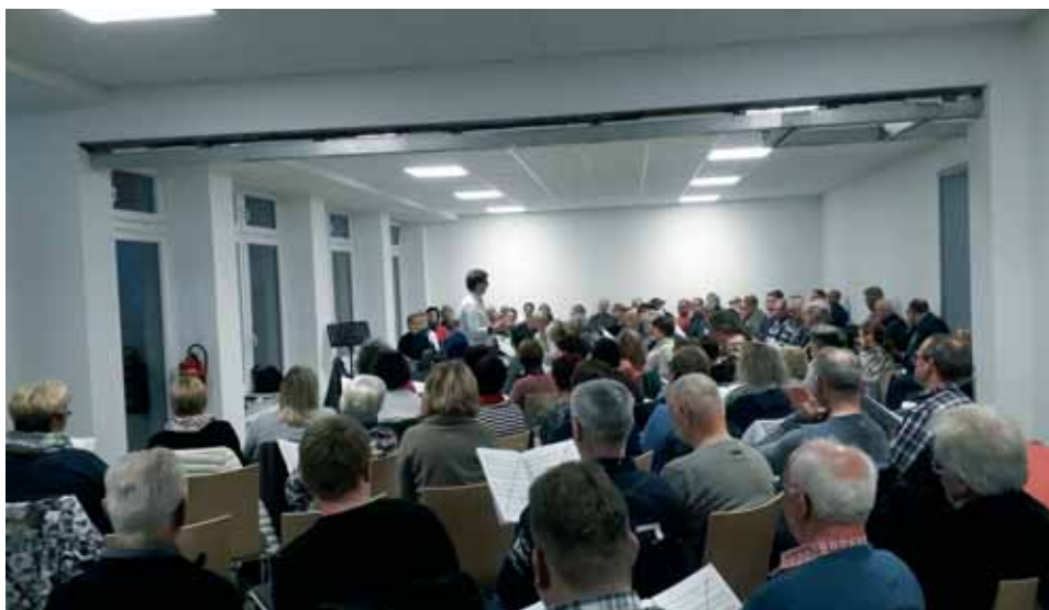
Stimmbildungsworkshop im Sängerkreis Wohrratal

So stellte er auch heraus, dass Lieder, in denen der Chorleiter sowohl dirigieren, aber auch Klavier spielen möchte, jeder Chorleiter gerne Gottheit wäre... eine indische Gottheit wohl gemerkt, „die mit den vielen Armen“. Es war ein erfolgreicher Workshop, den man mit dem Stimmbildner gerne wiederholen kann.