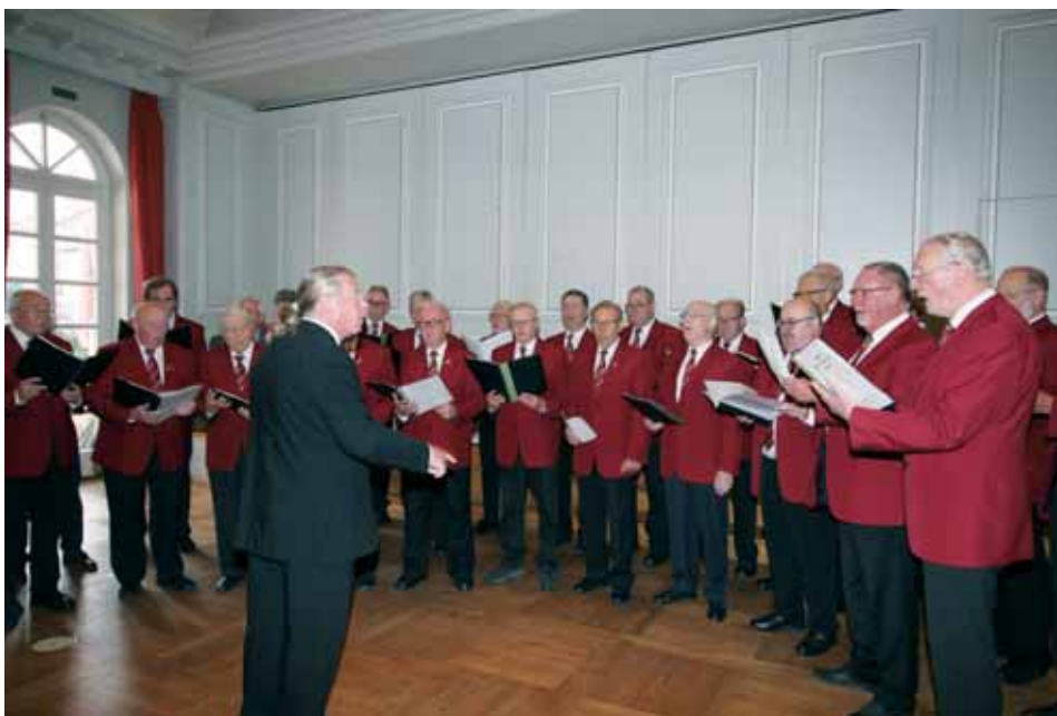
Männerchor Concordia/Liedertafel Melsungen