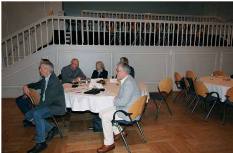
Delegierte der GA-Sitzung