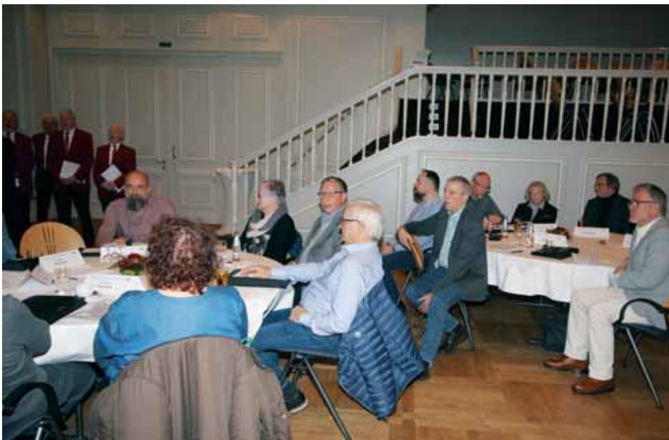
Delegierte der GA-Sitzung

Der Chorwettbewerb Ende September in Korbach hat rein musikalisch gesehen an Qualität gewonnen. Nicht zuletzt die vorher angebotenen Beratungssingen haben dazu beigetragen.