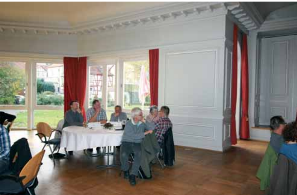
Delegierte der GA-Sitzung