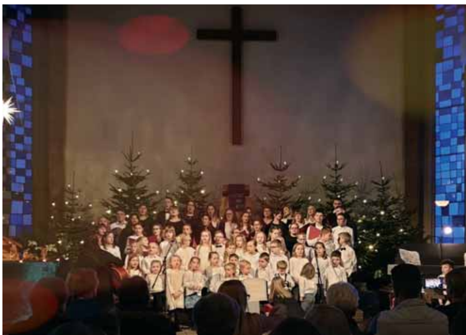
Kinder und Jugendchor Erksdorf