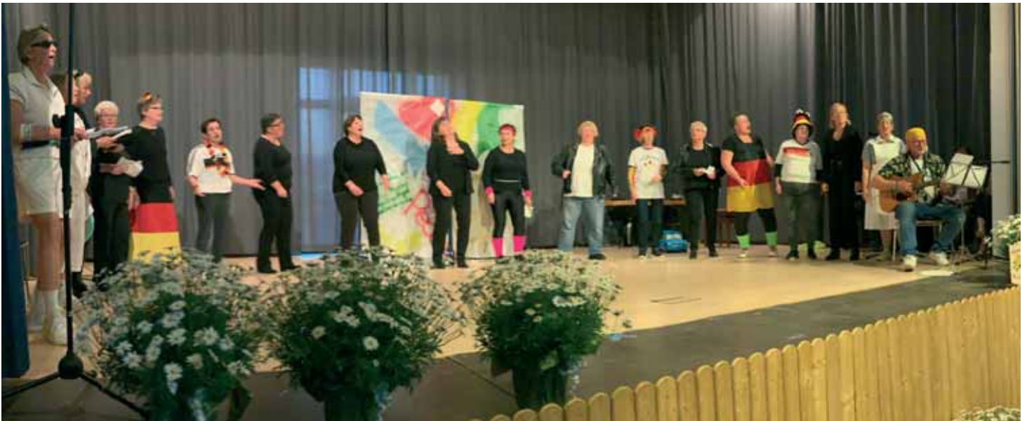
Kirchen- und Frauenchor Rauschenberg