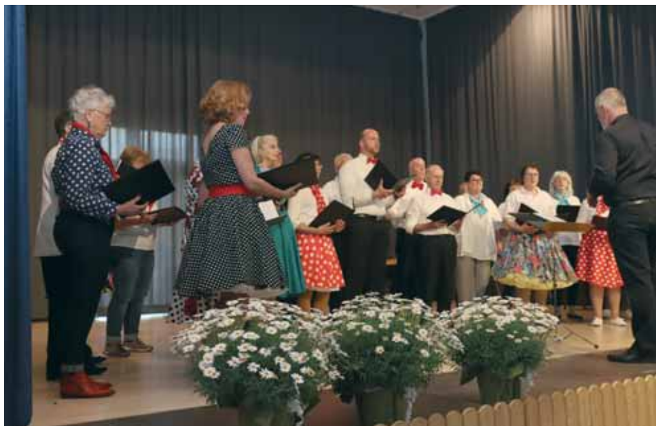
Gemischter Chor Momberg