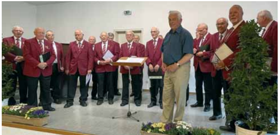
Concordia Liedertafel Melsungen