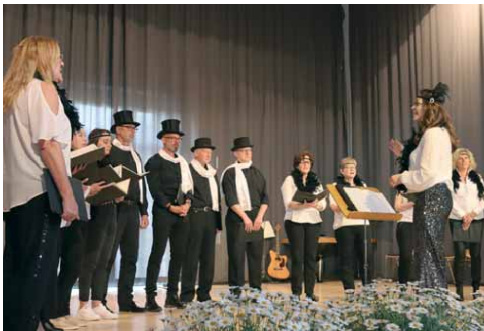
Gemischter Chor Speckswinkel