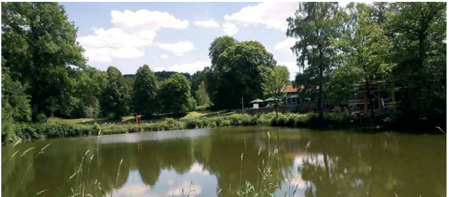
Badensee unterhalb der Burg Wallenstein

Um es kurz zu machen, wir freuen uns darauf mit Ihnen unseren Chorsänger zu füllen!