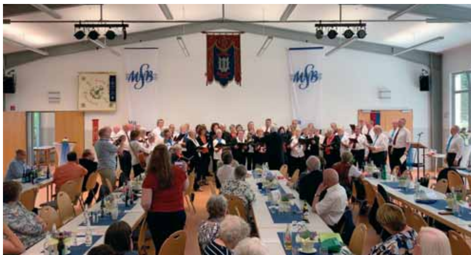
100 Jahre Volkschor Günsterode 1923eV - Alle Chöre singen zum Abschluss den Günster-City-Song