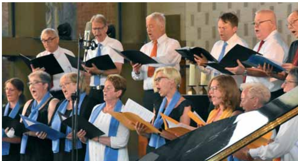
Aus vollen Kehlen. Der Projektchor der Sängerguppe bot Chorgesang vom Feinsten und entführte das Publikum in die USA.