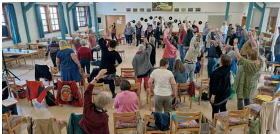
Bewegungsübung zu Probenbeginn

Redaktionsschluss für die nächste Ausgabe „Der Chorsänger“ 12. November 2023