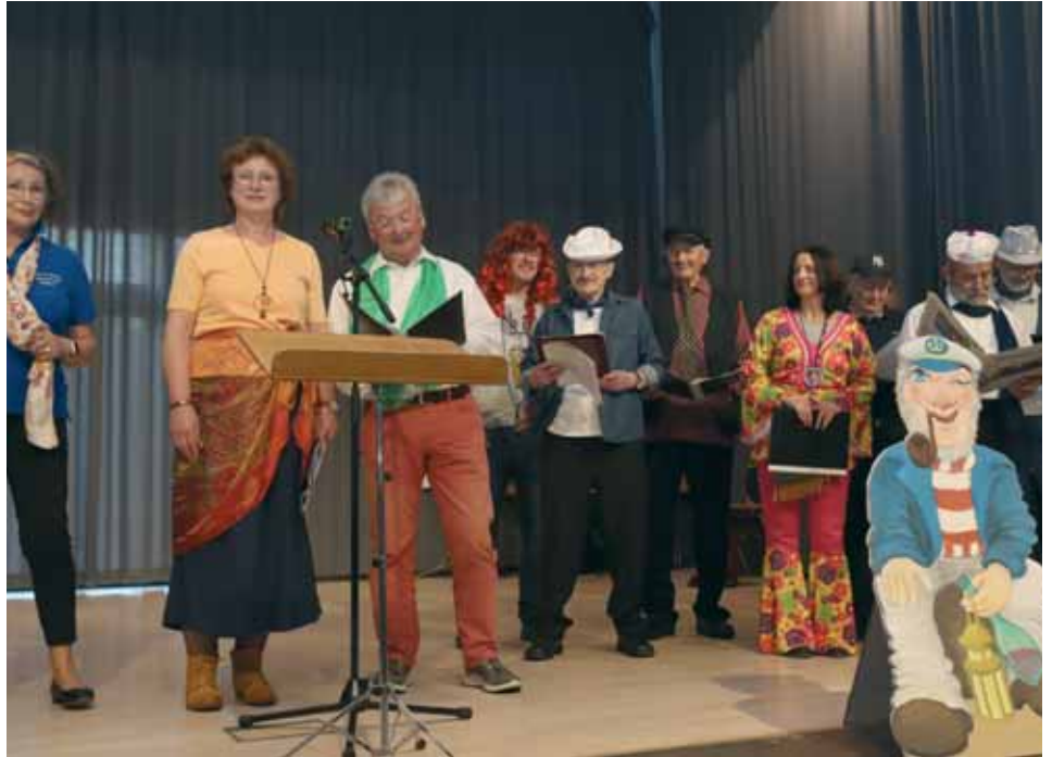
Gemischter Chor Schwabendorf