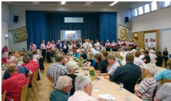
Jubiläumschor und Publikum