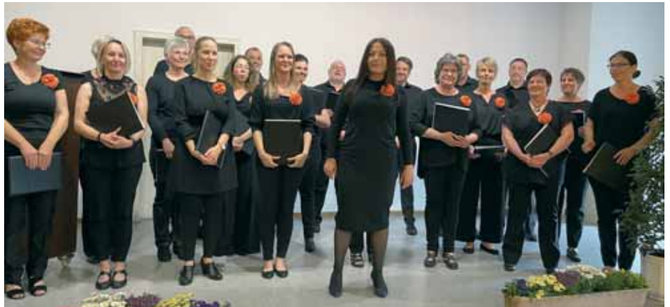
Gemischter Chor Wollrode