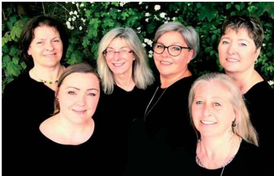
Rosewood a cappella