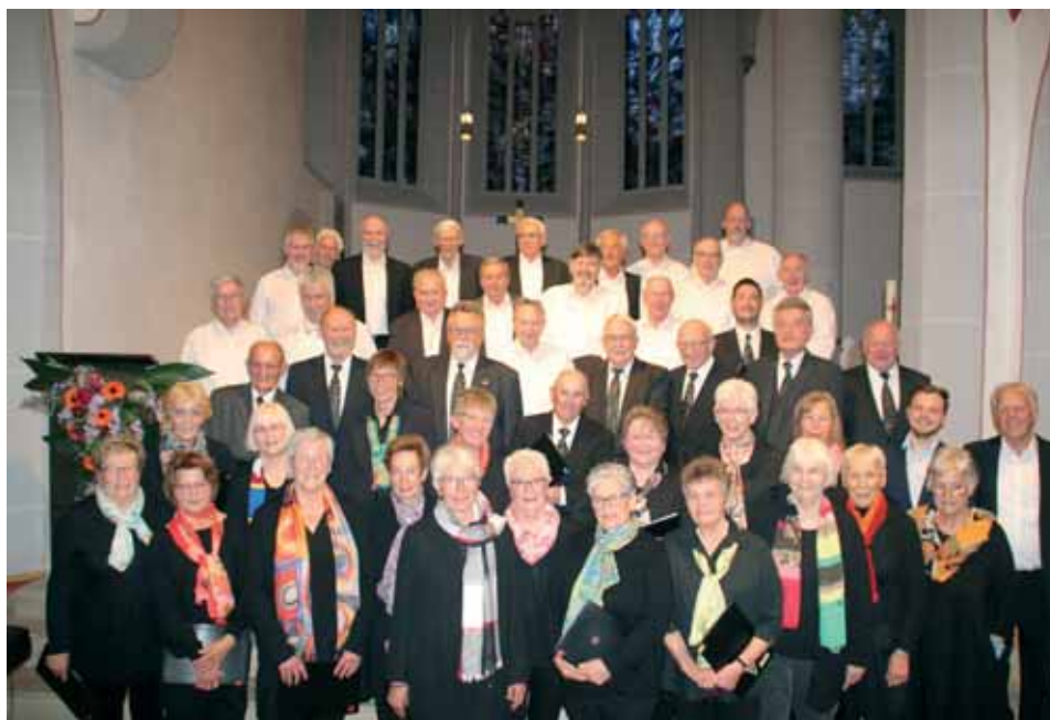
Chormusik von der Klassik bis zur Moderne boten der er Chorverein Liederkrantz 1902 und der Männergesangverein Liedertafel 1842 Spangenberg am Freitagabend in der Stadtkirche. Wegen Corona musste das Konzert schon zweimal abgesagt werden. Unser Gruppenbild entstand nach dem Konzert.

In dieser Form ist das einmalig in der Region: Zwei Spangenberg Gesangsvereine brachten es im vergangenen Jahr auf genau 300 Jahre Chorgesang: Der Liederkrantz