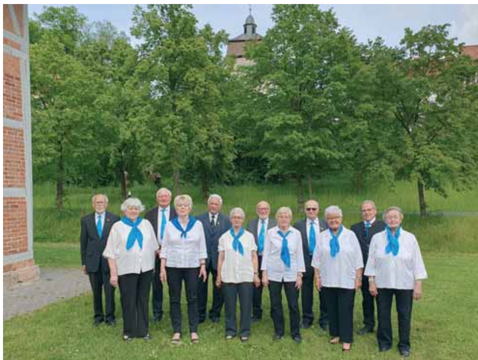
100 Jahre Volkschor Günsterode 1923eV - Aktive Sänger im Jubiläumsjahr

In der Pause mit großem Kuchenbuffet gab eine von Georg Horn erstellte umfangreiche Bilderausstellung Gelegenheit, sich an