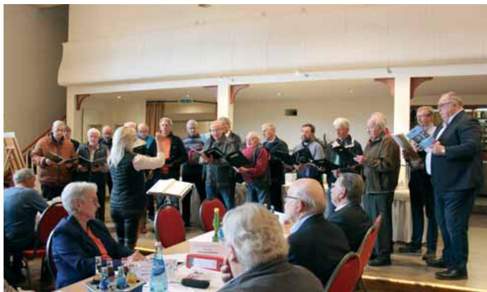
Singgemeinschaft des MGv Freudenthal und der MGv Spieskappel