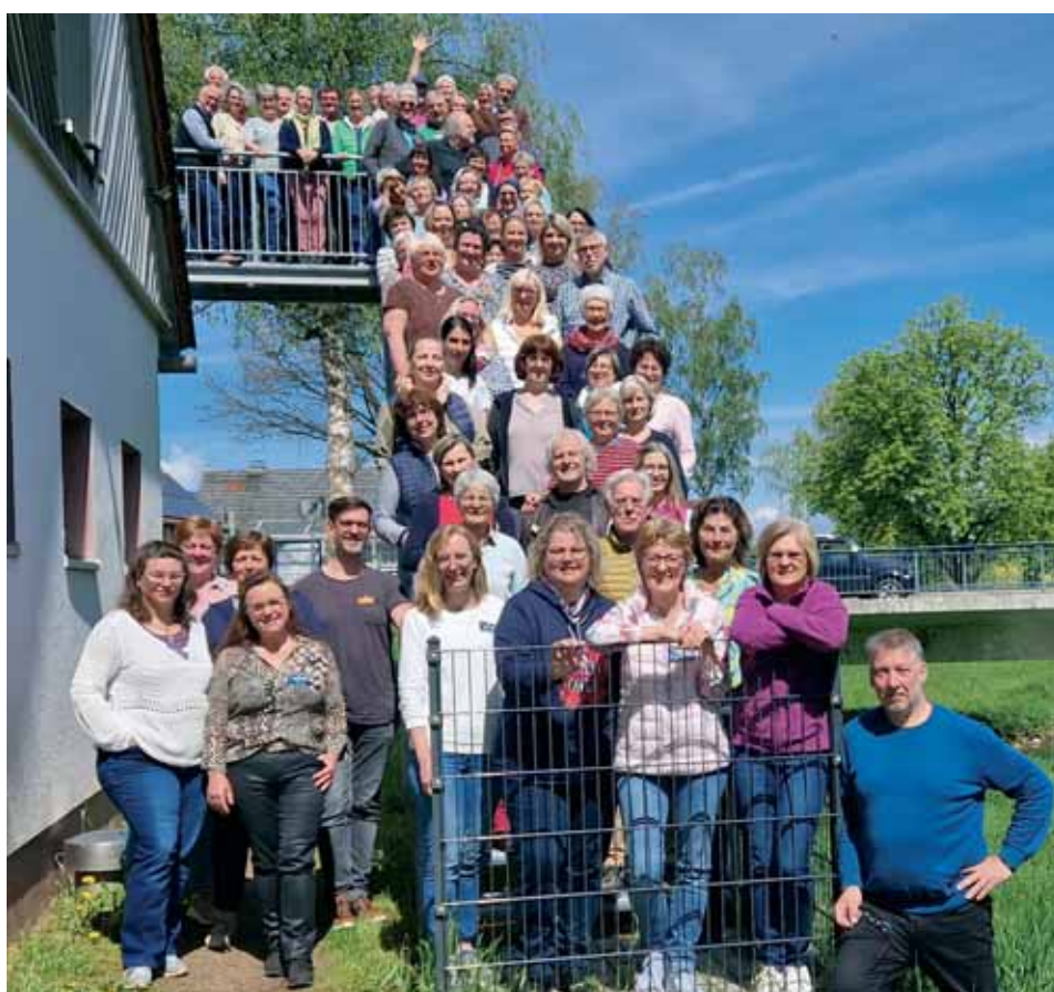
Die Workshopteilnehmerinnen und -teilnehmer