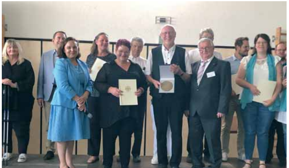
Die Übergabe der Zelter-Plakette für die Liedertafel Schweinsbühl

Mit der Deutschen Nationalhymne, gesungen von allen Besuchern, wurde die Feierstunde beendet. Nach einem kleinen Imbiss, den die Stadt den Besuchern der Feierstunde servierte, traten die Schweinsbühler mit dem Gefühl etwas Besonderes an diesem Tag erlebt zu haben, die Heimreise in das Waldecker Land an. (ft)