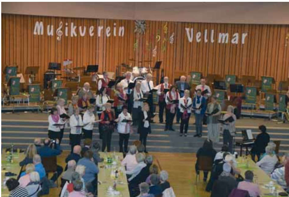
Mit Musik und Gesang in den Frühling