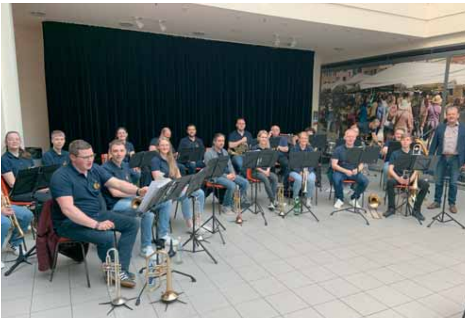
Blechbläserensemble der Modell- und Gesamtschule Bad Hersfeld in der City Galerie

Am so genannten Rotary Action Day am 13. Mai konzertierte das Blechbläserensemble der Modell- und Gesamtschule Bad Hersfeld in der City Galerie. Über 60 Minuten lang begeisterten die jungen Musiker mit schmissigen Titeln aus Rock- und Popmusik die Zuhörer und ernteten begeisterten Applaus. Die Rotarier hatten das Thema Umweltverschmutzung durch Plastik in den Focus gerückt und waren dankbar, dass die Musik viele Interessierte anlockte.